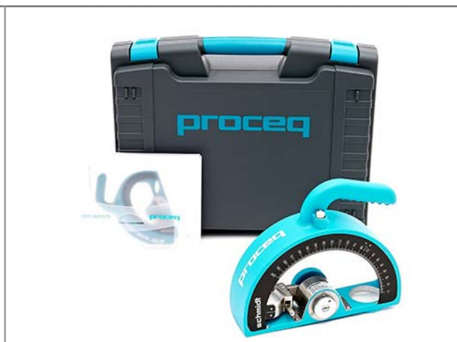
Рис. 4 Маятниковый молоток SCHMIDT модель OS-120 PM

В настоящее время пополнился спектр приборов, реализующих другой известный неразрушающий метод определения прочности бетона – метод отрыва. Это приборы серийного ряда DYNA DY. Данные приборы для определения прочности на отрыв диска от поверхности (или адгезиметры) предназначены для определения поверхностной прочности самого бетона (когезии), а также измерения адгезии к бетону покрытий любого типа (раствора, штукатурки, пластичных и термопластичных материалов и т.д.).