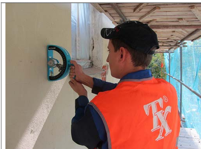
Рис. 3 Определение прочности штукатурки маятниковым молотком SCHMIDT OS-120 PT