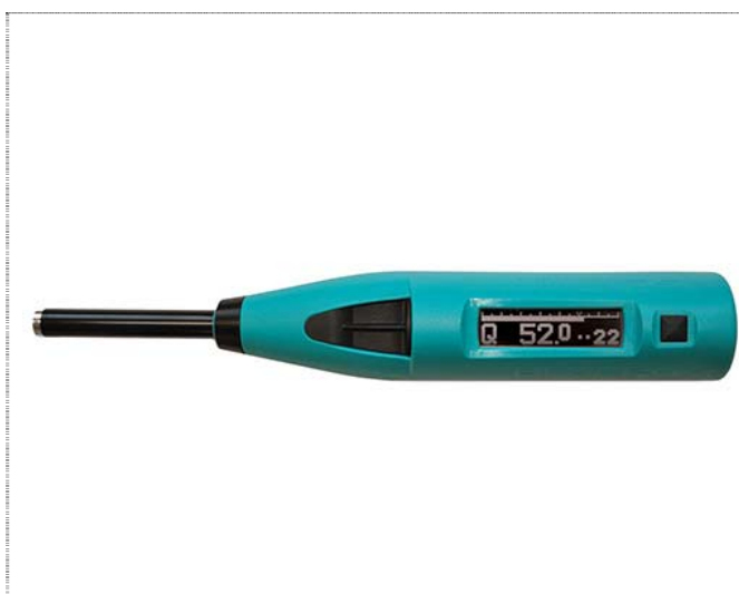
Рис. 1 Прибор SilverSchmidt

Один из самых широко применяемых методов это - определение прочности бетона склерометрическим методом. Уже получил достаточную известность прибор SilverSchmidt, работающий по несколько новому принципу определения прочности бетона.