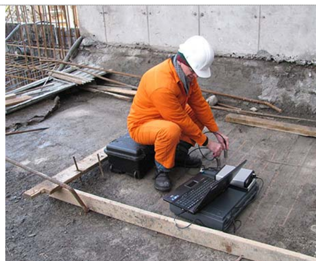
Рис. 10 Работа прибором PUNDIT на стройплощадке