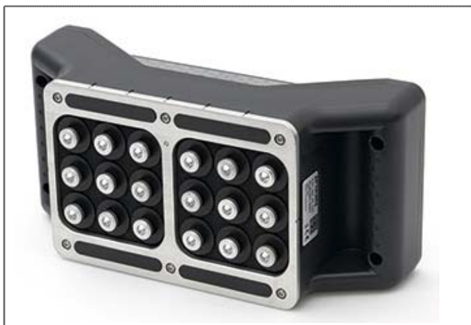
Рис. 11 Преобразователь эхо-импульса прибора PUNDIT PL-200 PE

Большим достижением является возможность оснащения прибора преобразователем эхо-импульса, позволяющим проводить ультразвуковую томографию бетона.