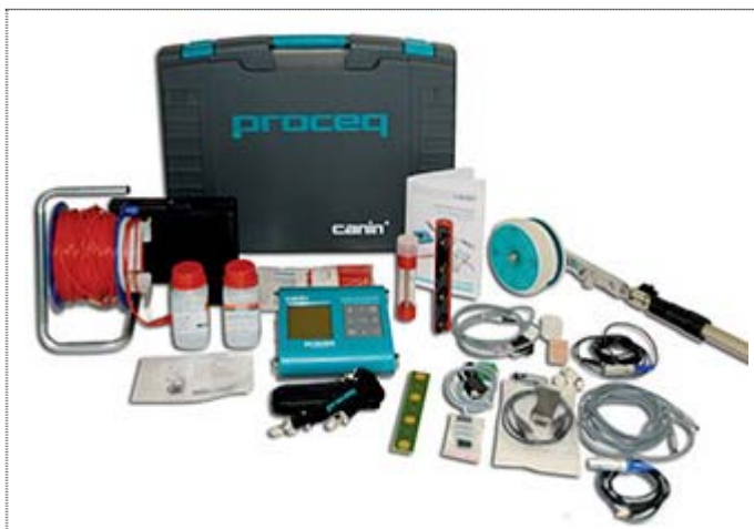
Рис. 13 Прибор CANIN+

различные изменения, и в настоящее время используется совместное применение медно-сульфатных стержневых электродов, роликовых электродов и пробника Веннера.