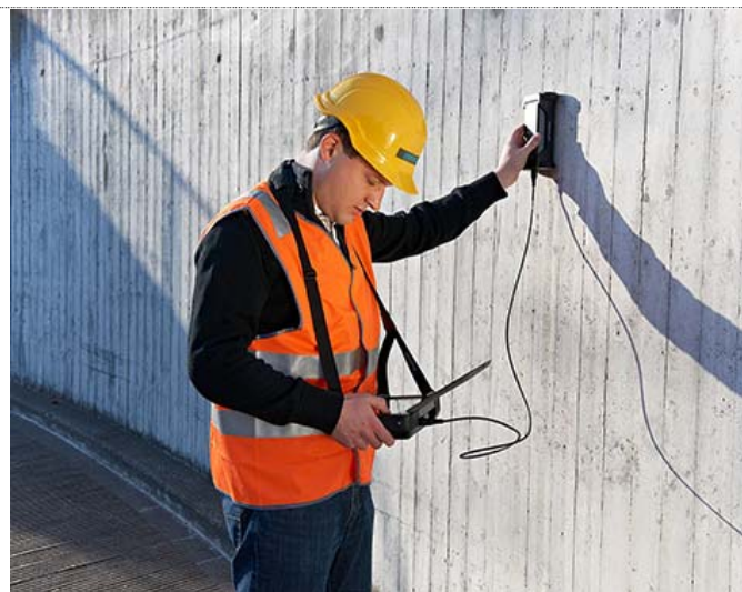
Рис. 8 Работа прибором серии PROFOMETER 600

Стоит отметить, что прибор получил возможности обработки данных на уровне компьютера, имеет флеш-память 8 Гб, позволяющую запомнить большие массивы данных, а затем продолжить обработку полученных значений в офисе после работы на строительном объекте либо непосредственно в электронном блоке прибора, либо на персональном компьютере с помощью программы PM-Link.