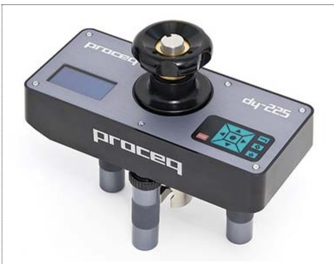
Рис. 5 Прибор DYNA DY-225

Преимущества данных приборов заключаются в их высокой точности (погрешность не более \pm 2.0\% ), мобильности и возможности установки в любой точке (горизонтальных и вертикальных поверхностей); автоматическом, плавном характере увеличения прилагаемой нагрузки; небольшой массе; независимости от внешних источников питания.