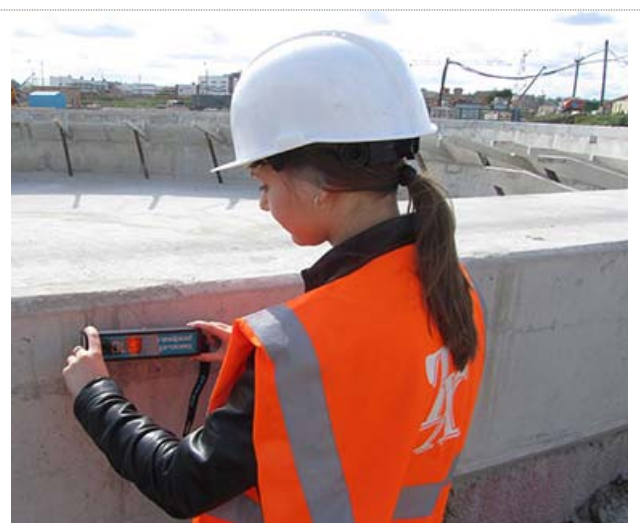
Рис. 16 Измерения прибором RESIPOD в натуральных условиях