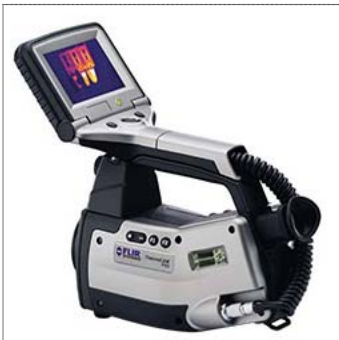
Рис. 20 Тепловизор ThermaCAM P65 (FLIR)