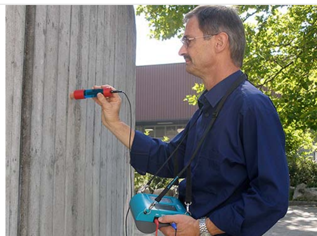
Рис. 14 Работа стержневым электродом прибора CANIN+

Таким образом, коррозия арматуры определяется двумя способами: измерением поля потенциала и определением удельного сопротивления бетона.