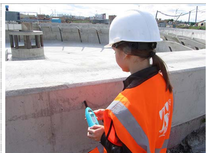
Рис. 2 Определение прочности прибором SilverSchmidt

В данном приборе реализован алгоритм измерения скорости отскока ударной системы молотка от поверхности бетона (в отличие от измерения высоты отскока по стандартной склерометрической методике), вычисления отношения скоростей отскока к постоянной скорости движения ударной системы молотка до удара по бетону и установлении связи этой величины с прочностью бетона. По оценкам, проведенным за рубежом (в частности, институтом BAM (Федеральный институт исследования и тестирования материалов, Германия)), данный прибор обладает наименьшим разбросом результатов измерений по сравнению с “классическими” молотками SCHMIDT.