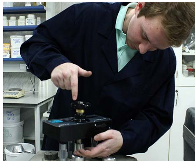
Рис. 6 Определение адгезии ремонтного состава в лаборатории

Для получения более точных результатов при испытаниях материалов с малой прочностью (например, штукатурок, цементно-песчаных стяжек) применяются приборы с небольшим усилием на отрыв DY-206, максимальное развиваемое усилие 6 кН. В основном приборы с таким усилием на отрыв применяются для испытаний различных гидроизоляционных материалов, нанесенных на бетон. Для определения прочности на отрыв бетона, а также определения адгезии нанесенных на бетон защитных покрытий применяют приборы с максимальными развиваемыми усилиями 16 или 25 кН соответственно, максимальная прочность на отрыв составляет 8,1 и 12,7 МПа.