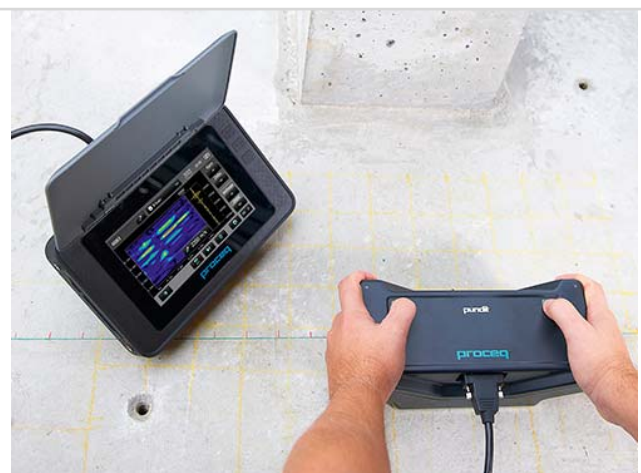
Рис. 12 Работа прибором PUNDIT PL-200 PE

Данная методика особенно эффективна при одностороннем доступе к конструкции (тоннели, подземные сооружения и пр.). Она позволяет определять толщину конструкций, наличие и месторасположение пустот, труб, расслоений и ячеистых структур. Применяя данный преобразователь, мы можем также получить вид конструкции в поперечном разрезе, перпендикулярном сканируемой поверхности. Мощное программное обеспечение и цифровые фильтры, задаваемые пользователем, улучшают качество получаемого изображения.