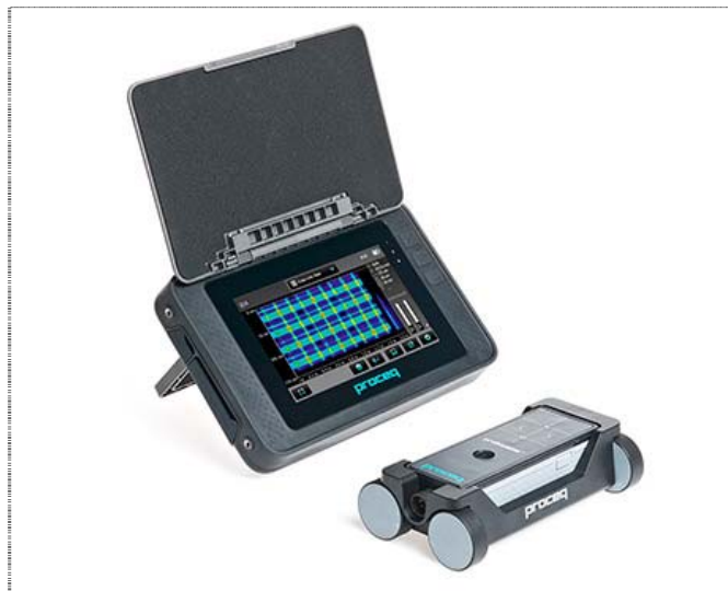
Рис. 7 Прибор PROFOMETER PM-600

Принципиально новым стал хорошо зарекомендовавший себя прибор PROFOMETER для определения параметров армирования железобетонных конструкций. Приборы нового поколения серии PROFOMETER 600 обладают большим цветным дисплеем с высокой разрешающей способностью. Сенсорный дисплей позволяет легко управлять прибором, переходить в различные режимы сканирования, изменять настройки, а также просматривать и редактировать полученные значения на экране прибора непосредственно на месте проведения измерений.