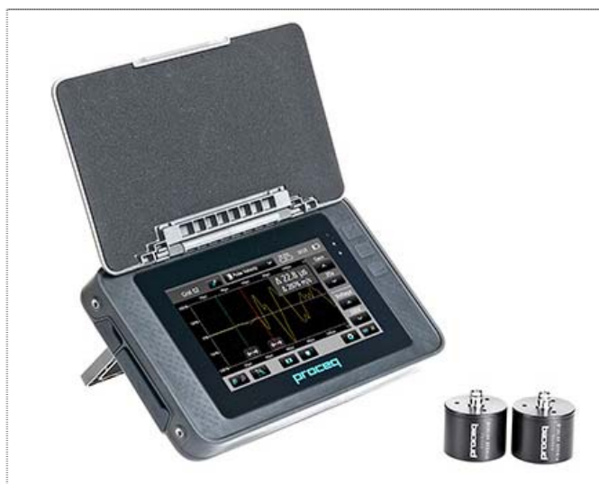
Рис. 9 Прибор PUNDIT PL-200

Аналогичное инновационное исполнение получил известный ультразвуковой прибор PUNDIT.