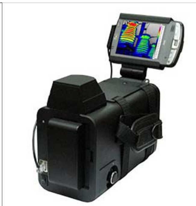
Рис. 21 Тепловизор ИРТИС-2000

Вышеописанные приборы позволяют повысить точность измерений, обладают повышенной мобильностью, дают возможность предварительной обработки измеренных значений непосредственно на стройплощадке. Такие достоинства уже позволили им найти свое место как при контроле строительства, так и на стадии эксплуатации строительных объектов различного назначения.